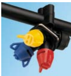
HARDI TRIPLET dyseholdere