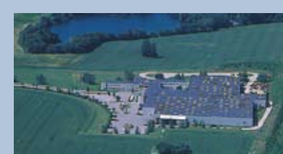
Høje Taastrup, Denmark