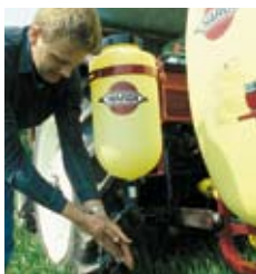
15 l rentvannstank