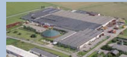
Nørre Alslev, Denmark