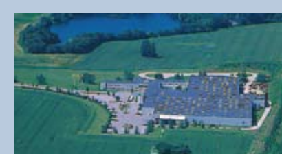
Heje Taastrup, Denmark