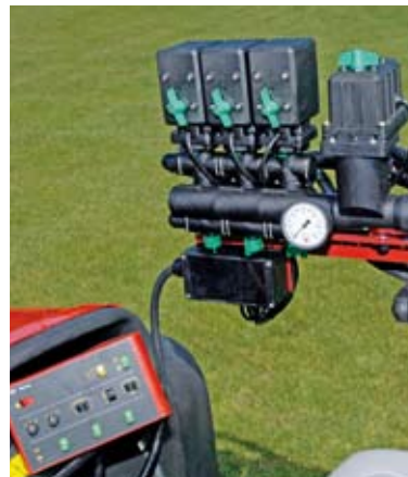
EVC armatur med HARDI MATIC

Den låga tanken och det optimerade vätskesystemet säkrar ett lågt kemikalieöverskott.