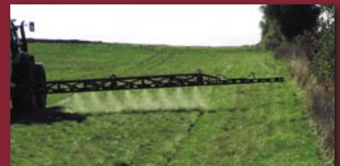
Bedst: slå en eller flere sektioner fra