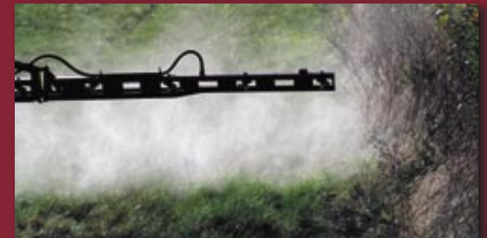
Undgå fine dråber i følsomme områder