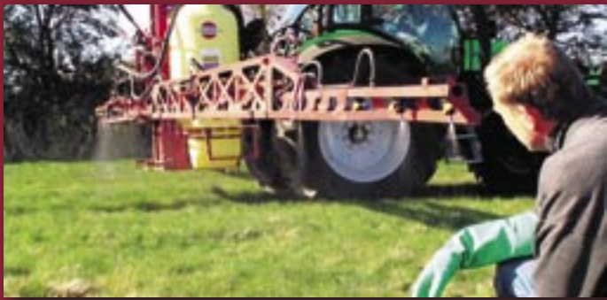
Visuel kontrol af dyser og væskefordeling