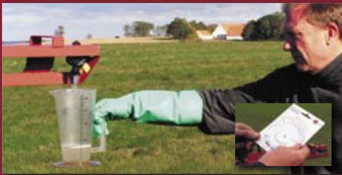
Kontroller hastighed, tryk og flow