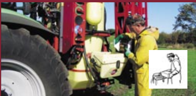
Tilsæt kemi i marken