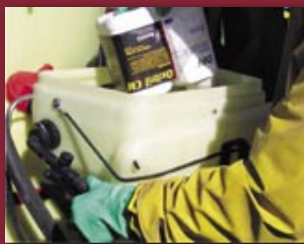
Rens dunke grundigt - sæt låget på igen