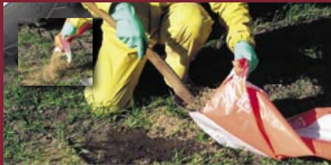
Vær forberedt på evt. spild (medbring absorberende granulat)